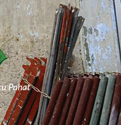
Pasar Pagi, Jalan Ibrahim, Batu Pahat