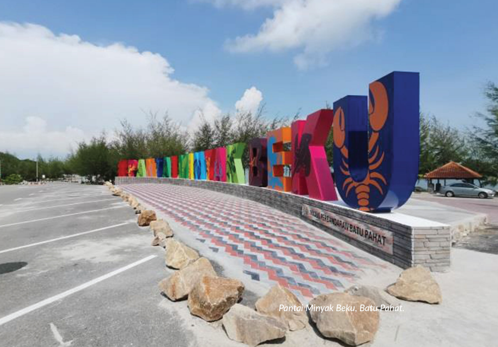
Pantai Minyak Beku, Batu Pahat.