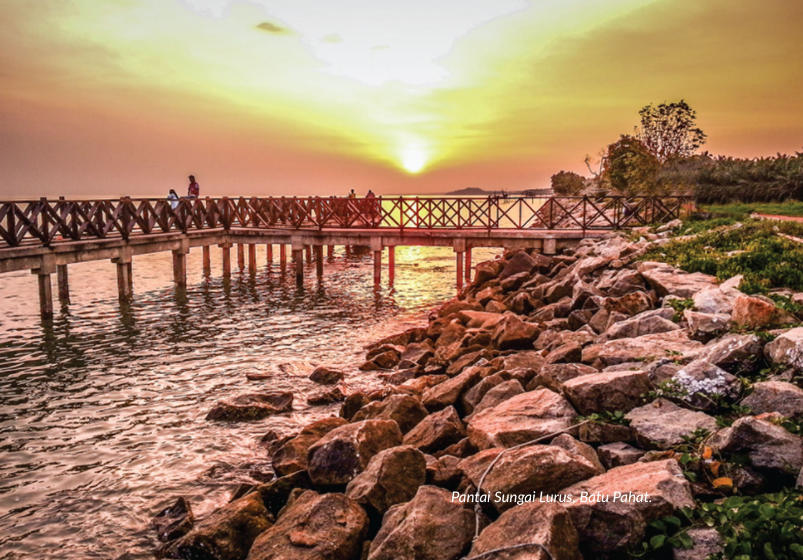
Pantai Sungai Lurus, Batu Pahat.