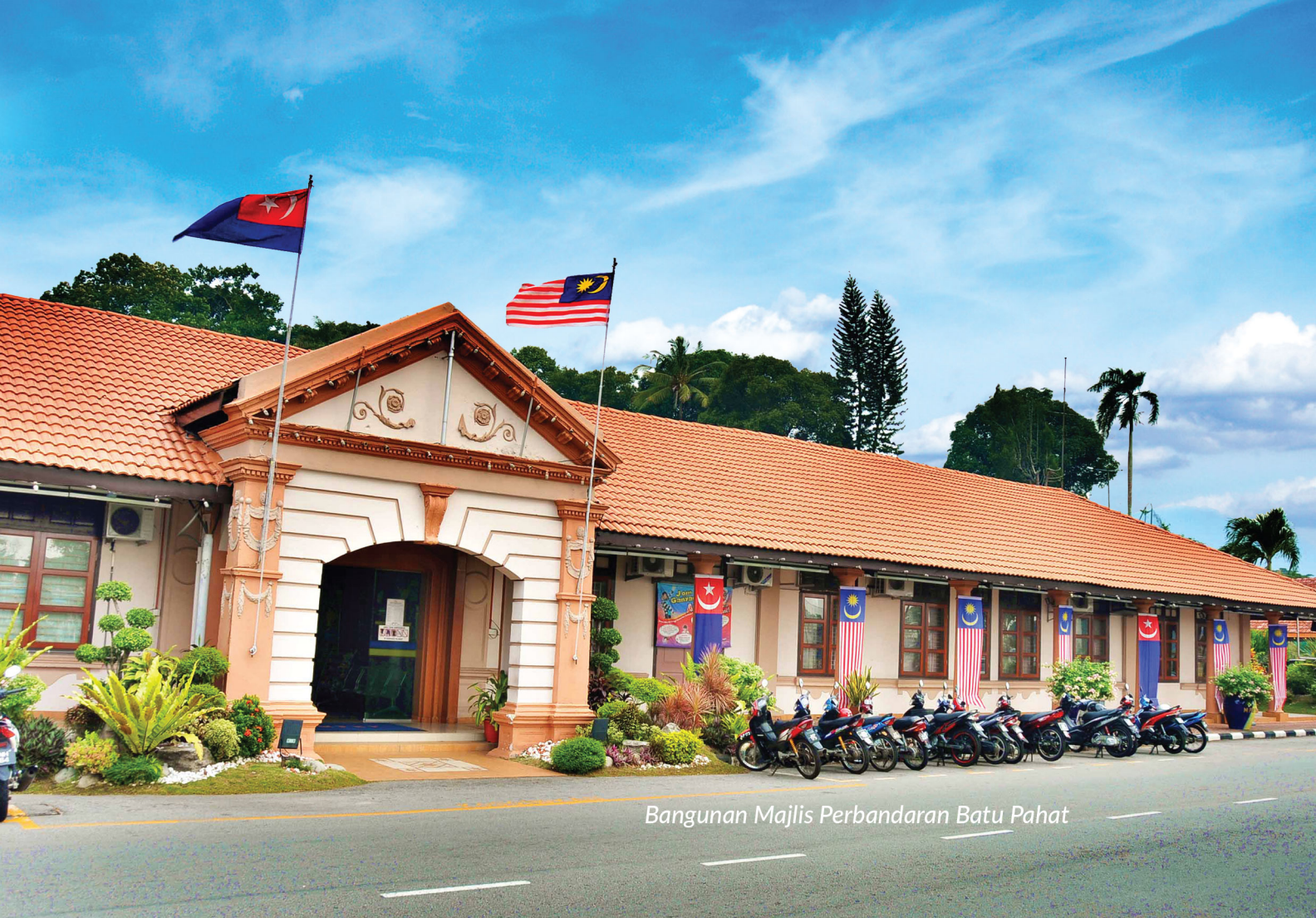
Bangunan Majlis Perbandaran Batu Pahat