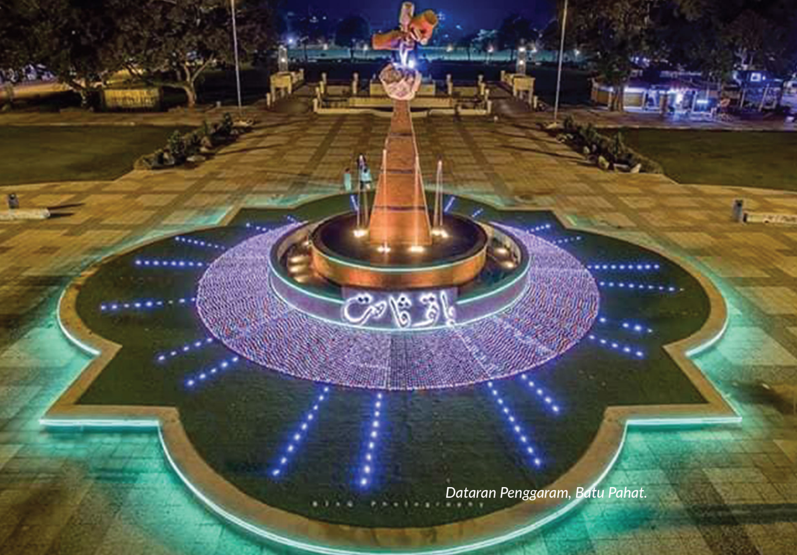
Dataran Penggaram, Batu Pahat.